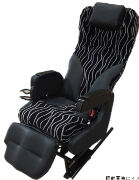
クレイドル・シート